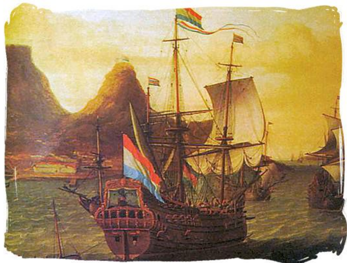
Spiegelretourschip de Jonge Thomas in de tafelbaai bij de Kaap.